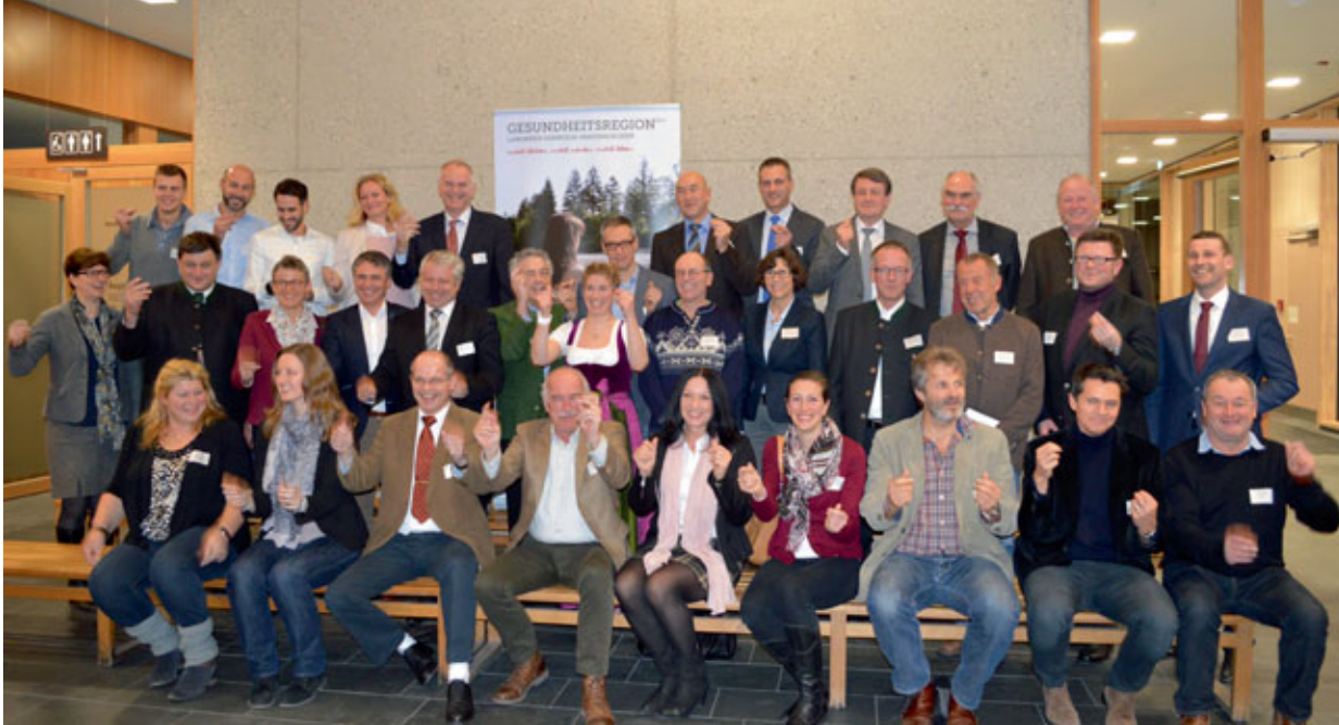
Die Mitglieder des Gesundheitsforums anlässlich der konstituierenden Sitzung im Landratsamt Garmisch-Partenkirchen

Mit dem Gesundheitsforum werden Experten an einen Tisch gebracht, um die Gesundheitsregion plus im Landkreis weiter zu stärken.