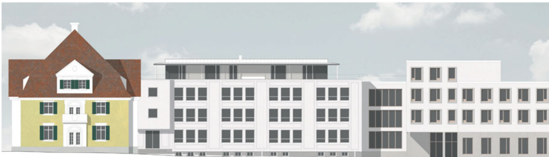
Ansicht auf das Landratsamt von der Olympiastraße. In der Mitte das sanierte Gebäude B mit dem neuen Terrassengeschoss.

Aufgrund der Bauarbeiten können im Innenhof des Landratsamtes derzeit keine Parkplätze angeboten werden. Das Landratsamt bitten daher, die Kurzzeitparkplätze an der Olympiastraße oder den Parkplatz an der St.-Martin-Straße (gegenüber Lidl) zu nutzen. Nach Abschluss der Bauarbeiten und der Umgestaltung des Innenhofs mit Begrünung werden jedoch wieder Parkplätze zur Verfügung stehen.