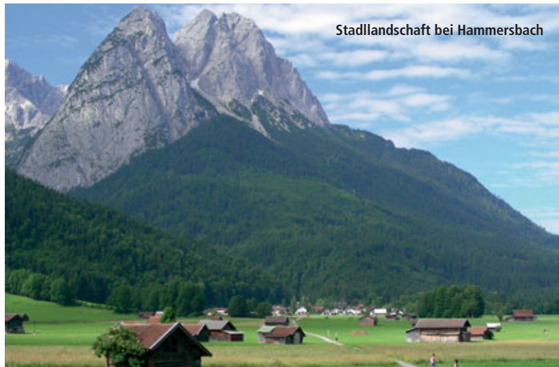
Stadllandschaft bei Hammersbach

Sollte es zur Verleihung eines Welterbetitels kommen, müsste festgestellt werden, dass dieser Reichtum Ausdruck einer besonderen Verbundenheit der Bewirtschafter mit ihrem landwirtschaftlichen Erbe ist. Dieses mögliche Welterbe ist daher zuallererst das Erbe unserer Bauern. Die Vorbereitung der Bewer-