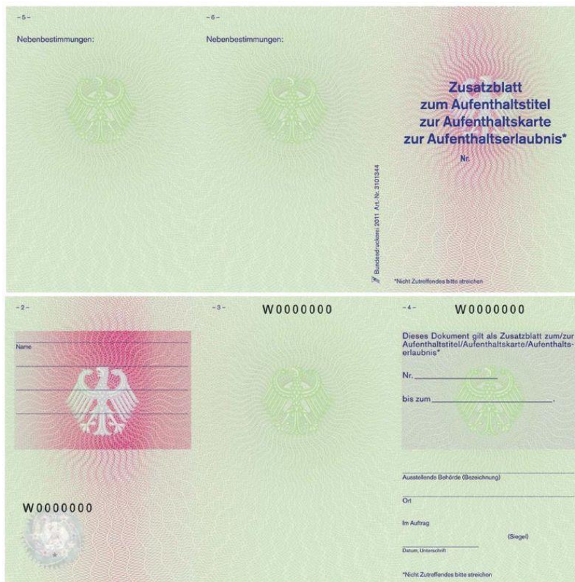
Beispiel für ein Zusatzblatt